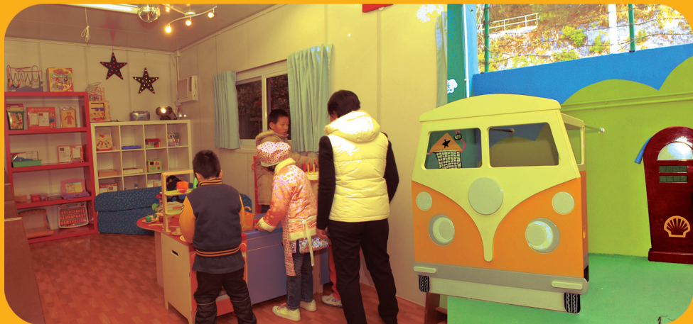
當年遊戲中心內部設施