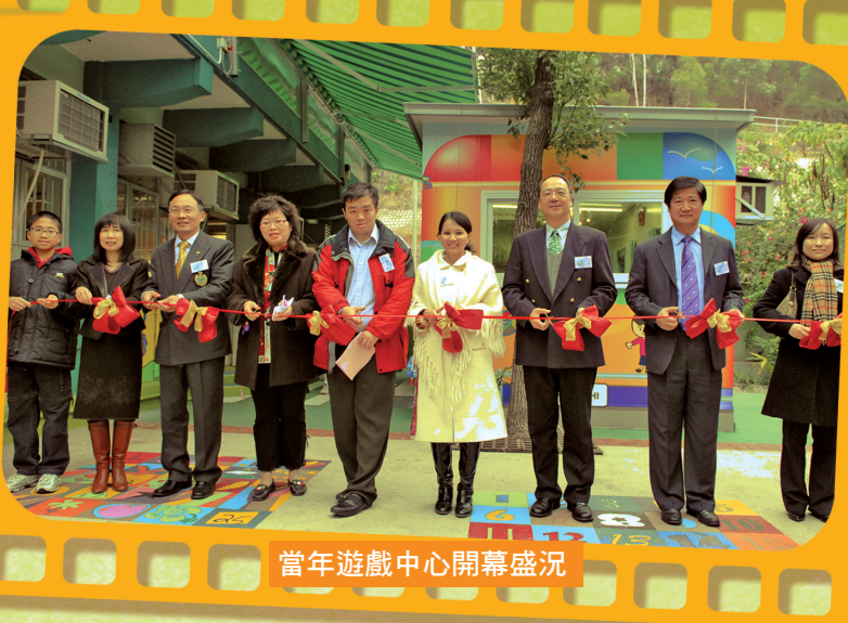
當年遊戲中心開幕盛況