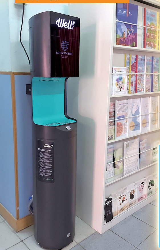
水機安裝在禮堂外的書架位置，方便學生使用

「Well 井」智能添水站是由一社企公司設計新穎的飲水機，希望藉推動大眾使用飲水機，達至減少膠樽使用數量。每部「智能添水站」會自動統計並在屏幕上顯示，累積有多少人次使用過，為地球節省了多少個膠樽，以鼓勵大眾持續參與。它又會顯示上次驗水的日期，以及根據濾水量，自動預測下次需要更換濾芯的時間。最貼心的是，添水站同時兼顧到水溫問題。天氣炎熱、自來水水溫偏高時，它會自動將來水溫度降低 3 至 5 度，調校至飲用時有微涼的感覺。晚上少人使用時，它會自動進入休眠狀態，將耗電量降至最低。此外，它還設有自動清洗程式，每日自動清洗 3 次，減低細菌滋生機會。「智能添水站」的管理高度智能化和高效率，可大大節省人力和時間。「智能添水站」亦廣泛用於商場及學校，目前教育基金亦積極聯繫其他曾受助的特殊學校，了解是否需要添置水機。