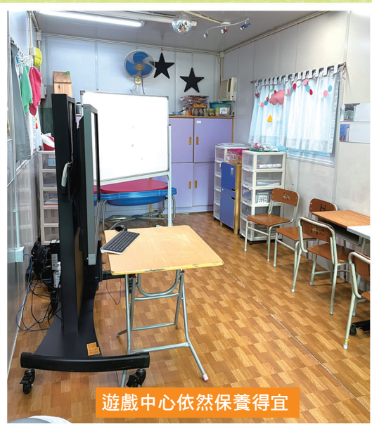
遊戲中心依然保養得宜