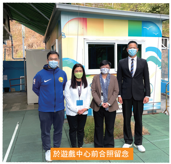
於遊戲中心前合照留念